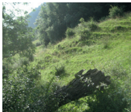
Abb. 4: Pflegebedürftige ökologische Ersatzfläche, Gemeinde Pfäfers (Massnahme B2).

Auf der orografisch rechten Seite der Taminaschlucht sind 30 Hektaren