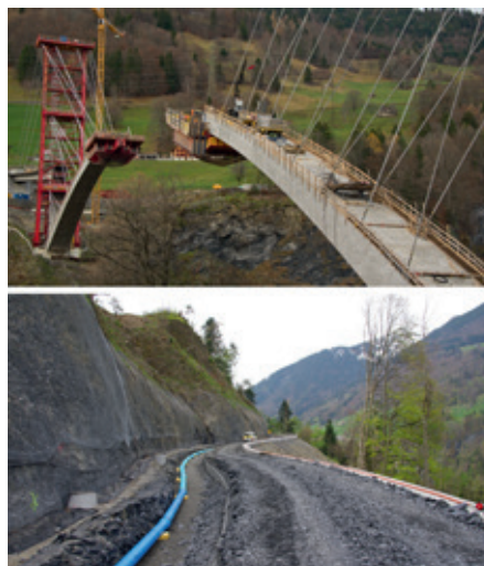
Abb. 2: Bau der Taminabrücke 2013-2017, inklusive Verbindungsstrasse.

Der Bau der Verbindungsstrasse beansprucht zwei Hektaren Wald. Alle Parteien waren sich einig, dass im Taminatal die Waldrodungen nicht vollumfänglich mit Realersatz auszugleichen sind, sondern