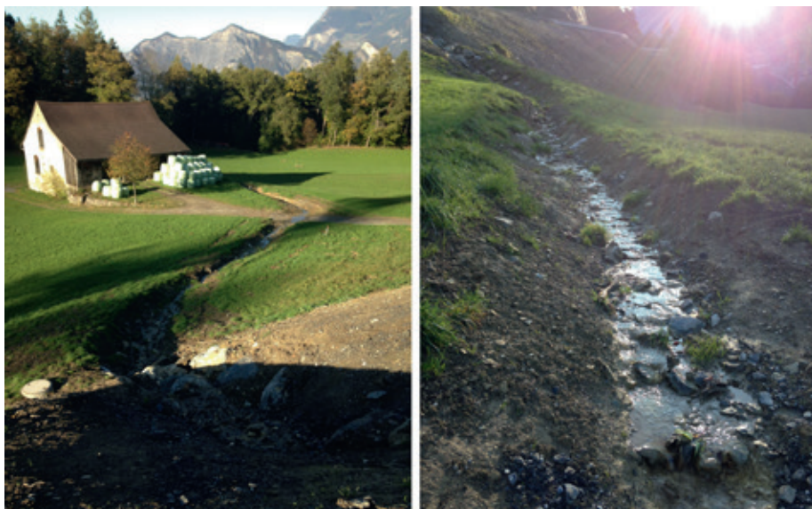
Abb. 3: Ökologische Aufwertung Valur (Massnahme A1).

Da das Gebiet des Rheintals und des Taminatals wertvolle Lebensräume für Fledermäuse darstellen, wurde in Abstimmung mit den Fledermausverantwortlichen des Kt. St.Gallen entschieden, in den fünf Brückenkästen Strukturen für Fledermäuse einzurichten.